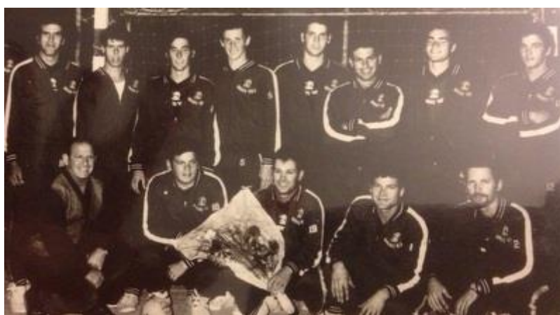
הפועל כפר מנחם (מערכת ONE)