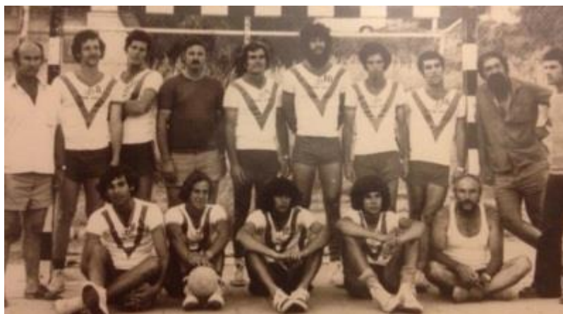
הפועל כפר מנחם (מערכת ONE)